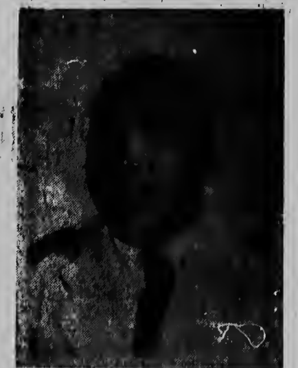
Senior Wijngaarde casi sigur lo hanja un puesto den Eilandsraad, como cu S. E. Minister Yrausquin lo keda ocupa e ministerio.